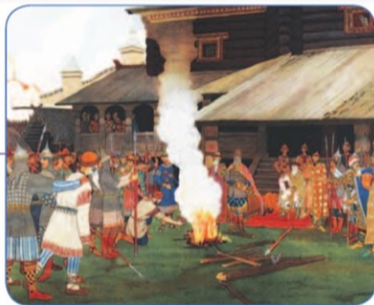
Суд во времена Русской Правды. И. Я. Билибин

Что вам известно о порядке решения вопроса о виновности человека на Руси? Какие признаки позволяют нам отнести этот обычай к правовым?