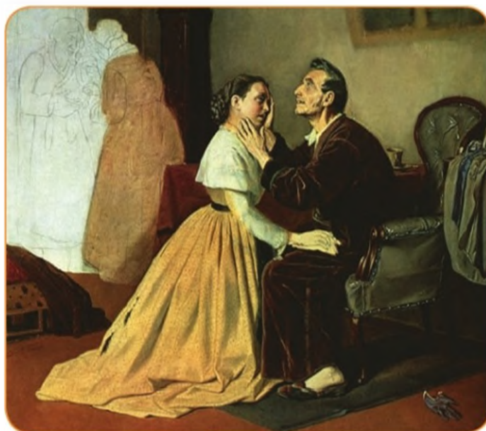
Приезд институтки к слепому отцу. В. Г. Перов.

Какой изобразил художник девушку, приехавшую к отцу? Что переживают отец и дочь во время встречи? Какими средствами художнику удалось запечатлеть их чувства?