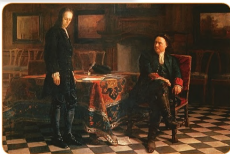
Пётр I допрашивает царевича Алексея Петровича в Петергофе. Н. Н. Ге

По каким признакам можно достоверно судить о том, что перед нами конфликт? Как ведут себя герои? Кто перед кем виноват?