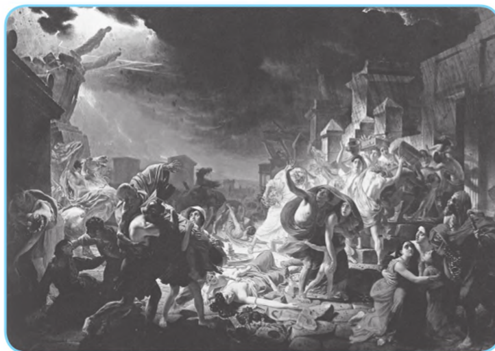
К. П. Брюллов. Последний день Помпеи. 1833 г.

Это, по сути, картина-катастрофа. Но восприятие её вызывает у нас восхищение мастерством художника, его тщательно выстроенной композицией, удивительной пластикой и живописностью фигур! Приведите примеры, когда восприятие драматических образов вызывало у вас восхищение.