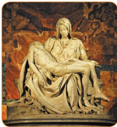
Пьета. 1499 г. Собор Святого Петра. Ватикан. Микеланджело

Какими произведениями культуры и именами их создателей вы бы дополнили представленный ряд?