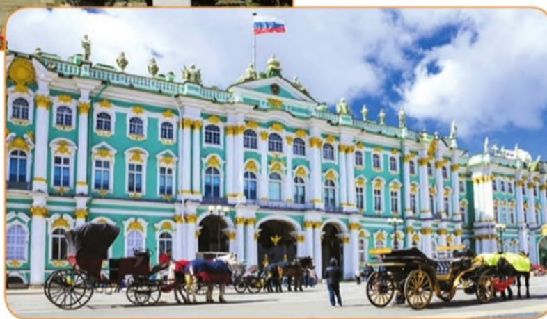
Государственный Эрмитаж. Санкт-Петербург

Знаете ли вы, какие музеи есть в вашем регионе? А вы давно были в музее? Подготовьте вместе с одноклассниками проект «Виртуальная экскурсия по музеям нашего района».