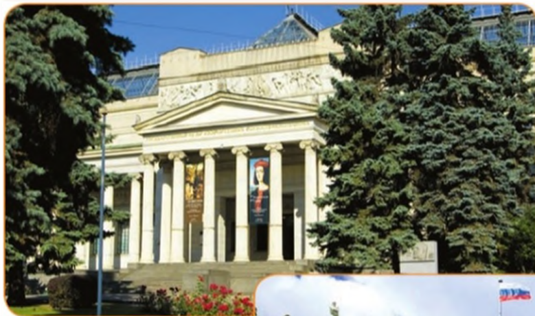
ГМИИ им. А. С. Пушкина. Москва