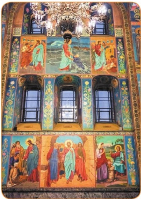
Храм Спаса на Крови. Интерьер. Санкт-Петербург