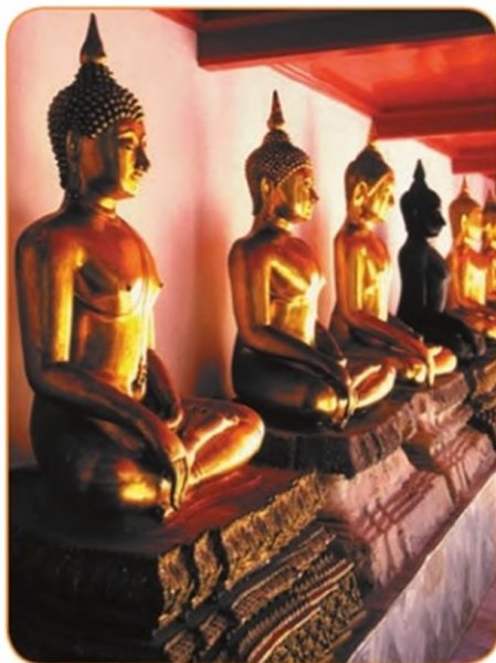
Золотой Будда в храме Ват Траймит. Бангкок. Таиланд