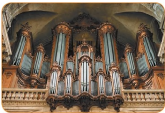
Орган. Кафедральный собор. Нанси, Франция