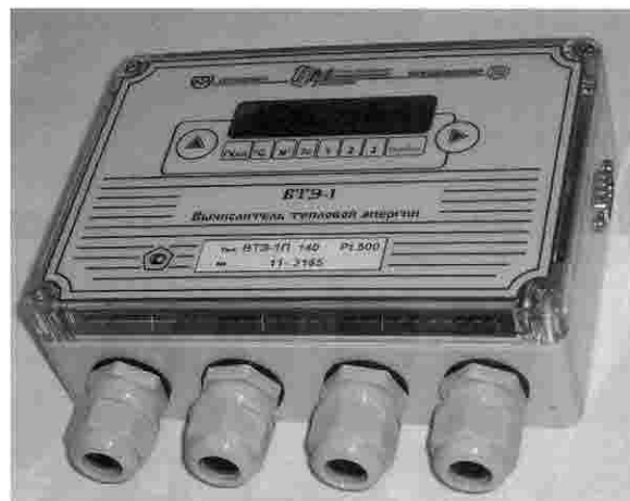
а) б) Внешний вид вычислителя тепловой энергии ВТЭ-1 а) модификация - К; б) модификация - П

Место нанесения поверительного клейма в виде наклейки