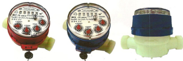
Рис.5 Счетчик горячей и холодной воды VSG-15-01, VCS-15-01

Счетчики типа ВСХ, ВСХд, ВСГ, ВСГд, VCT DN 15; 20 - 01 корпус изготовлен из высокопрочной пластмассы, имеют пяти - разрядный барабанный счетный механизм и четыре стрелочных индикатора (рис.5)