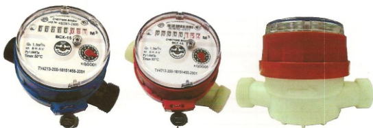
Рис.10 Счетчики холодной и горячей воды BCX-15-03; BCG-15-03

Счетчики типа BCX, BCXд, BCG, BCGд, BCT DN 15 - 03 корпус изготовлен из высокопрочной пластмассы, имеют восьми - разрядный барабанный счетный механизм и один стрелочный индикатор (рис.10).