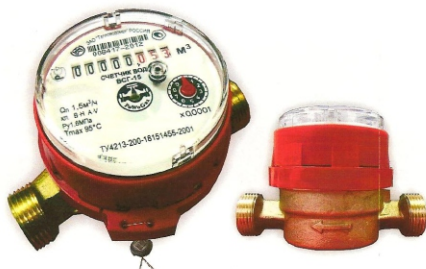
Рис.6 Счетчик горячей воды ВСГ-15-02