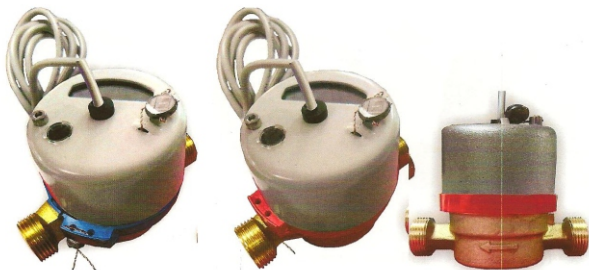
Рис.3 Счетчики холодной и горячей воды с магнитоуправляемым контактом ВСХд-15, ВСГд-15