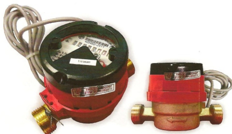
Рис.7 Счетчик горячей воды с магнитоуправляемым контактом ВСГд-15-02