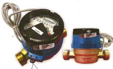
Рис.8 Счетчик холодной воды с магнитоуправляемым контактом ВСХд-15-02