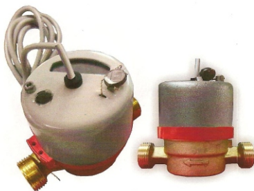
Рис.4 Счетчик горячей воды с магнитоуправляемым контактом VST-15

Счетчики типа ВСХ, ВСХд, ВСГ, ВСГд, VCT DN 15; 20 - 01 корпус изготовлен из высокопрочной пластмассы, имеют пяти - разрядный барабанный счетный механизм и четыре стрелочных индикатора (рис.5)