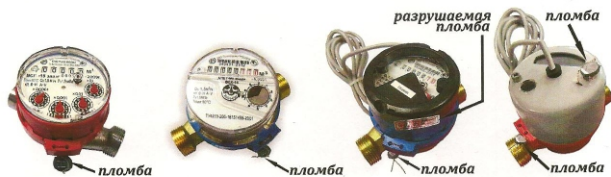
Рис.1 Схема пломбировки приборов от несанкционированного доступа

Счетный механизм крепится к корпусу при помощи пластикового прижимного кольца с ушком для опломбирования от несанкционированного вмешательства.