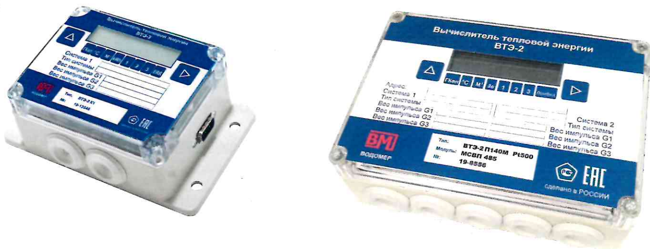
Рисунок 1– Общий вид средства измерений