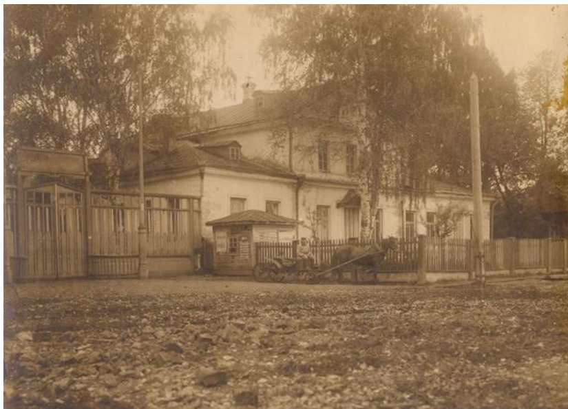
Фото дома горного начальника Камско-Воткинского завода И.П.Чайковского.