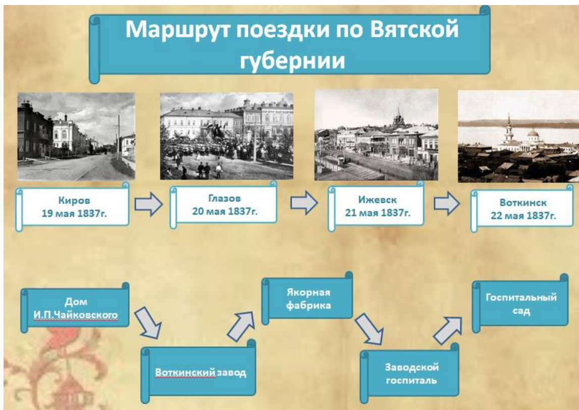
Схема маршрута Цесаревича со свитой по Вятской губернии.