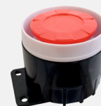
Аварийная сирена «DS-01»