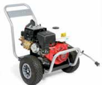
BENZ-C H2013Pi P