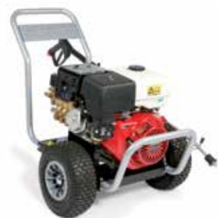
BENZ-C L2021Pi P