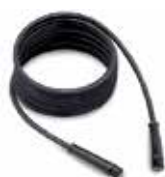
Шланг высокого давления 10 м Код ТВАР 25324