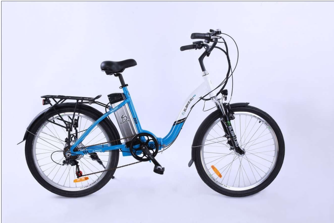
ELBIKE GALANT BIG