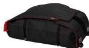
Сумка для перевозки коляски Universal Travel Bag