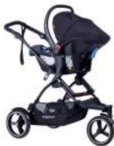
Адаптер Maxi-Cosi Adaptor Dot Maxi-Cosi