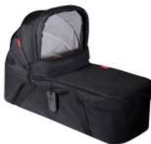
Блок для новорожденного Snug Carrycot