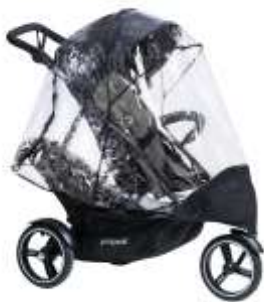
Дождевик Dot Storm Cover