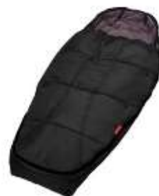
Спальный мешок Sleeping Bag