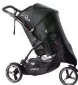
Москитная сетка Dot Mesh Cover