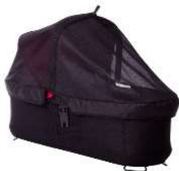
Carrycot Mesh Cover