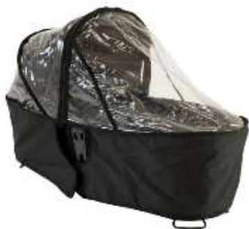
Carrycot Storm Cover