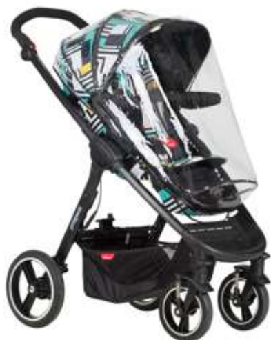
Дождевик Mod Storm Cover