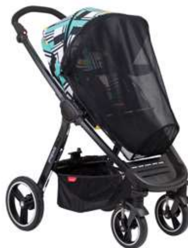
Защита от солнца и УФ лучей Mod Mesh Cover