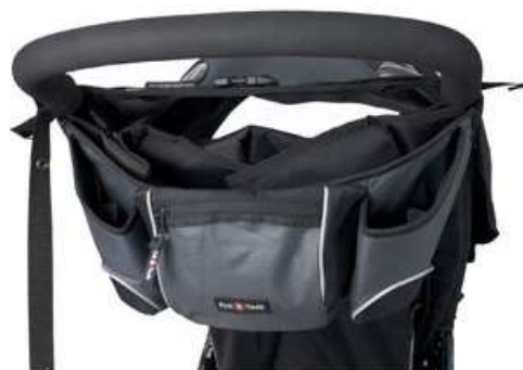
Сумка на ручку Stroller Hang Bag