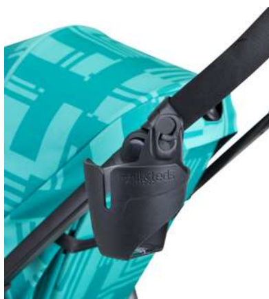
Подстаканник Cup Holder