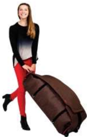
Сумка для перевозки коляски Universal Travel Bag