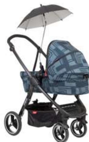
Солнечный зонт Parasol