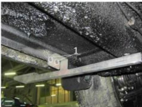
Рис.5 Установка переднего кронштейна