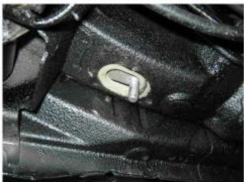
Рис.4 Установка шпильки закладной M10 в месте установки заднего кронштейна