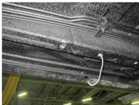
Рис.3 Установка гайки закладной M10 в месте установки среднего кронштейна