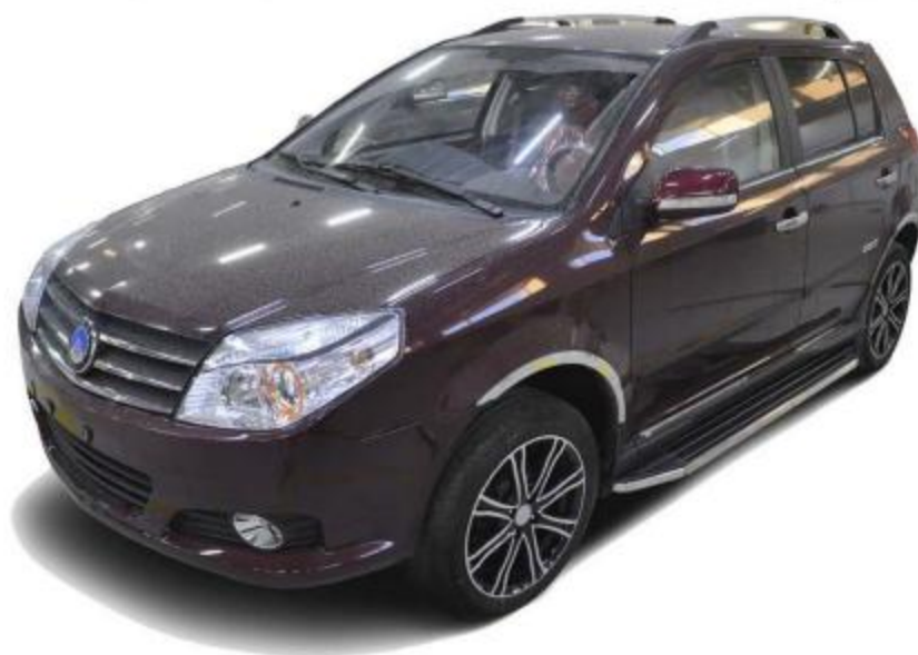
Рис.8 Вид автомобиля с порогом