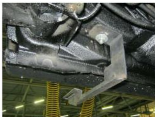
Рис.7 Установка заднего кронштейна