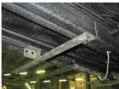
Рис.6 Установка среднего кронштейна