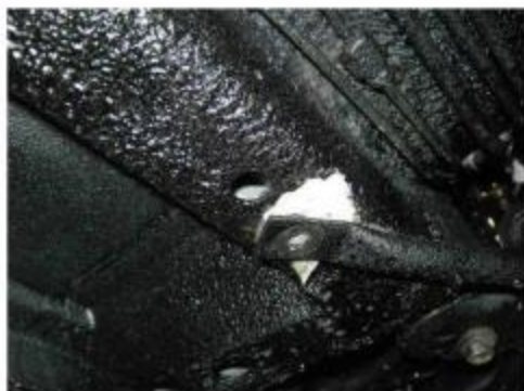
Рис.2 Рычаг автомобиля в месте крепления переднего кронштейна