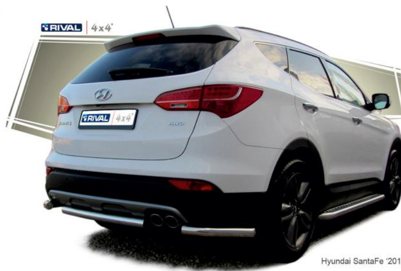
Hyundai SantaFe '2012