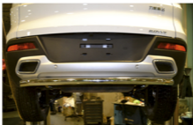
Рис. 4 - Общий вид автомобиля с защитой

Перед установкой изделия необходимо убедиться, что автомобиль, на который планируется установка, соответствует модельному ряду, указанному в настоящей инструкции. В случае затруднений с определением соответствия обратиться службу технической поддержки info@lifelife.com . В случае наезда на препятствие необходимо убедиться в отсутствии повреждений и визуально автомобиля и пригодности дальнейшей эксплуатации защиты. При правильной установке защита не должна касаться колес и агрегатов автомобиля. Производить вправо вносить изменения в конструкцию защиты.