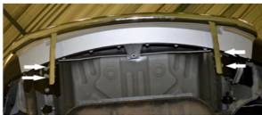
Рис. 3 - Установка защиты