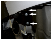
Рис. 1 - Установка левого кронштейна