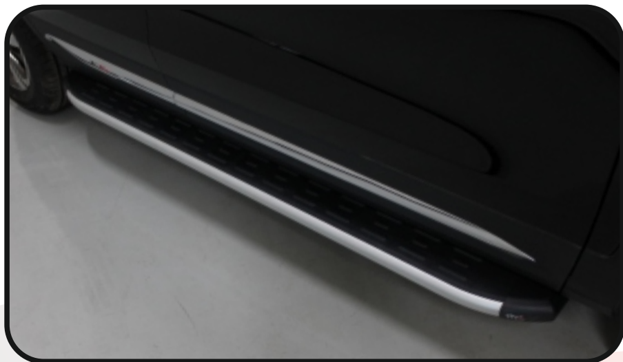
Пороги алюминиевые с пластиковой накладкой (1720) арт. CHANCS7520-24AL, GR, SL, BL CHANCS75PL23-16AL, GR, SL, BL