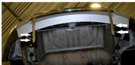
Рис. 3 - Установка защиты