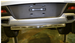
Рис. 4 - Общий вид автомобиля с защитой

Перед установкой изделия необходимо убедиться, что автомобиль, на который планируется установка, соответствует модельному ряду, указанному в настоящей инструкции. В случае затруднений с определением соответствия обратиться к службе технической поддержки info@lifelife.com . В случае наезда на препятствие необходимо убедиться в отсутствии повреждений и визуально проверить целостность дальнейшей эксплуатации защиты. При правильной установке защита не должна касаться углов и крепежа автомобиля. Производитель вправе вносить изменения в конструкцию защиты.