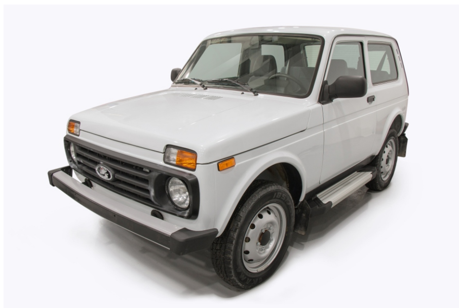
Общий вид автомобиля с порогом

Перед установкой изделия необходимо убедиться, что автомобиль, на который планируется установка, соответствует модельному ряду, указанному в настоящей инструкции. В случае затруднений с определением соответствия обращайтесь службу технической поддержки supp@rivalauto.com . В случае наезда на препятствие необходимо убедиться в отсутствии повреждений и агрегатов автомобиля и пригодности дальнейшей эксплуатации порогов. При правильной установке пороги не должны касаться узлов и агрегатов автомобиля. Производитель вправе вносить изменения в конструкцию порогов.