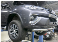
Рис. 4 - Общий вид автомобиля с защитой