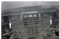
Рис. 1 - Установка фиксируемых гаек