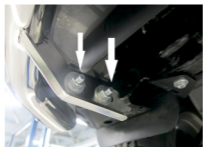
Рис. 3 - Установка защиты