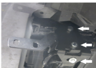
Рис. 2 - Установка кронштейнов