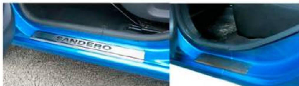
Фото установленных накладок

Накладки на остальные пороги устанавливаются аналогичным образом.