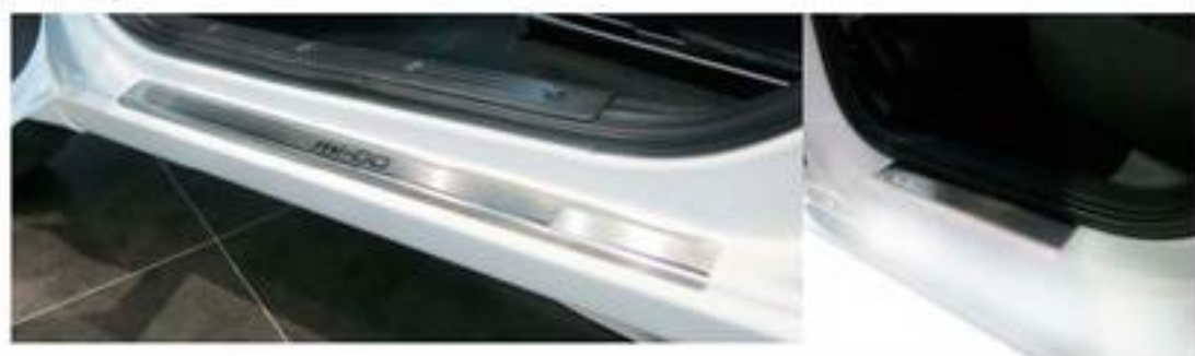
Фото установленных накладок

Накладки на остальные пороги устанавливаются аналогичным образом.