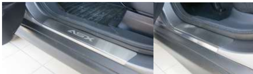
Фото установленных накладок