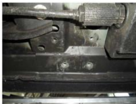
Рис.3 Место установки заднего кронштейна