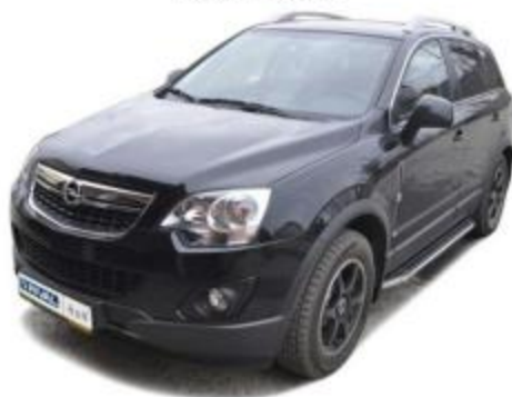
Рис.4 Вид автомобиля с порогом