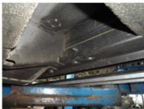
Рис.2 Место установки переднего кронштейна