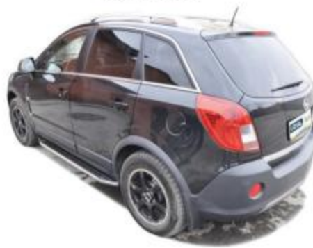
Рис.5 Вид автомобиля с порогом