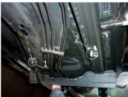
Рис.4 Место установки среднего кронштейна