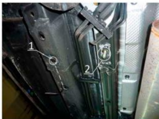
Рис.2 Место установки переднего кронштейна