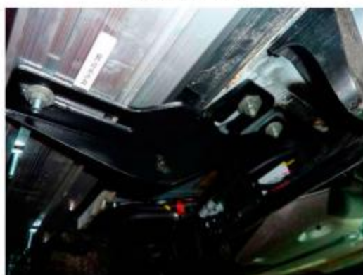
Рис.7 Установка заднего кронштейна