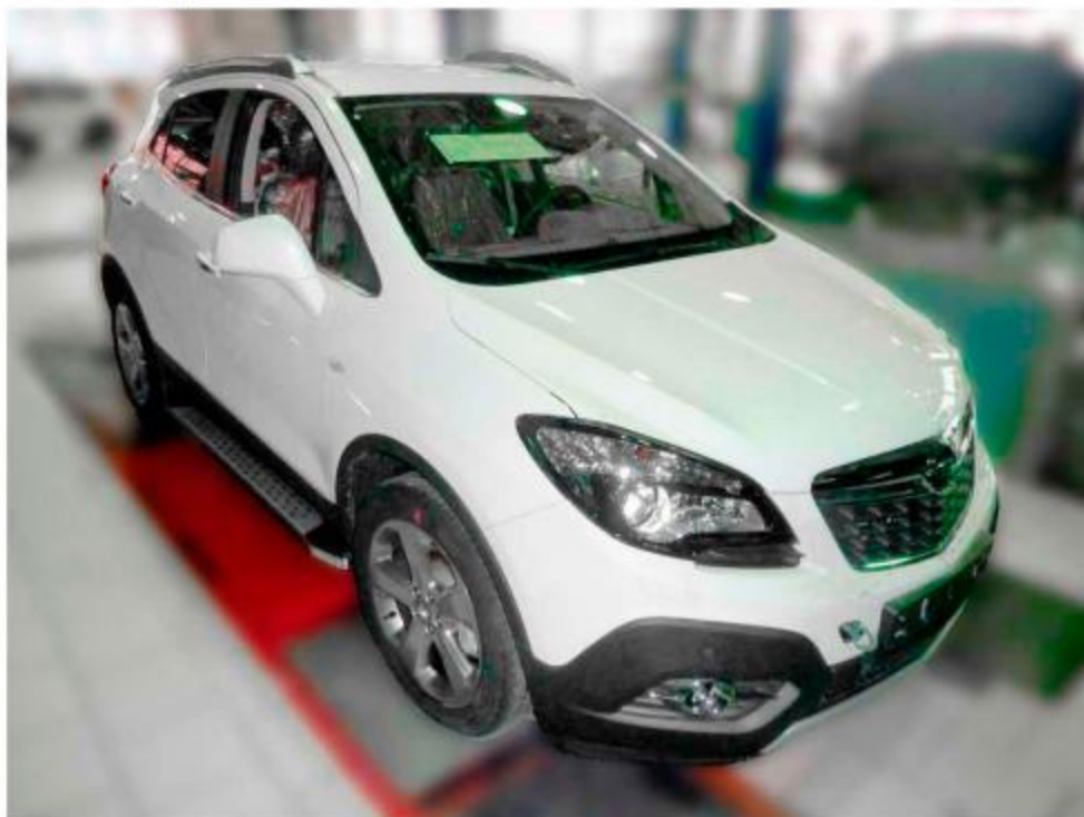
Рис.8 Вид автомобиля с порогом