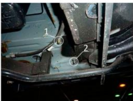
Рис.6 Место установки заднего кронштейна