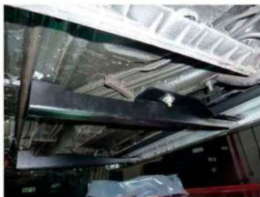
Рис.5 Вид Установка среднего кронштейна