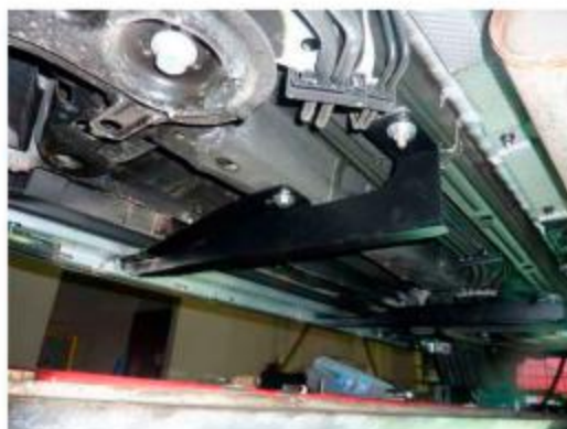
Рис.3 Установка переднего кронштейна