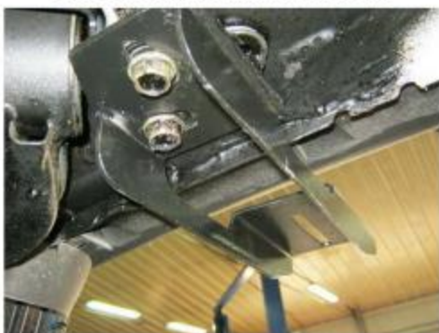
Рис. 6 Установка заднего кронштейна