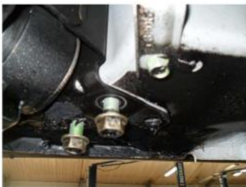
Рис. 2 Место крепления заднего кронштейна