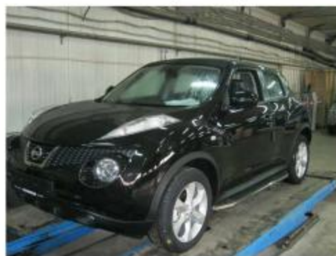
Рис. 7 Вид автомобиля с порогом