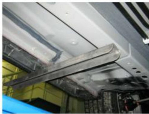
Рис. 5 Установка переднего кронштейна