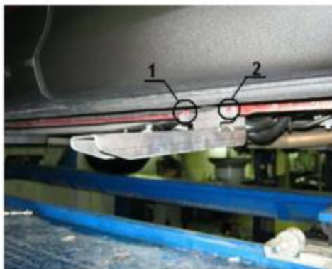
Рис. 4 Места для сверления отверстий