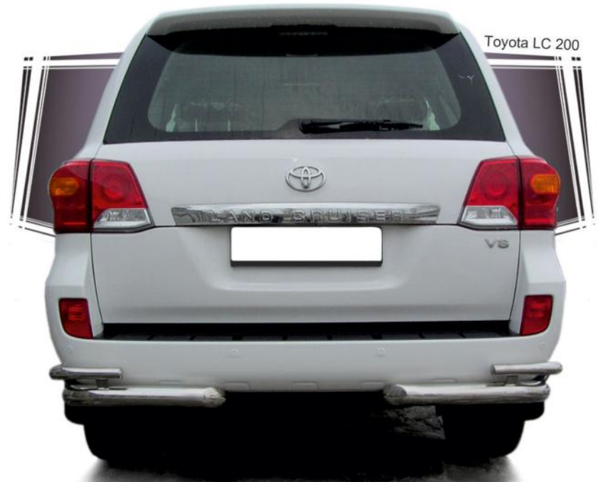
Toyota LC 200