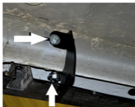
Рис. 1 - Установка переднего кронштейна