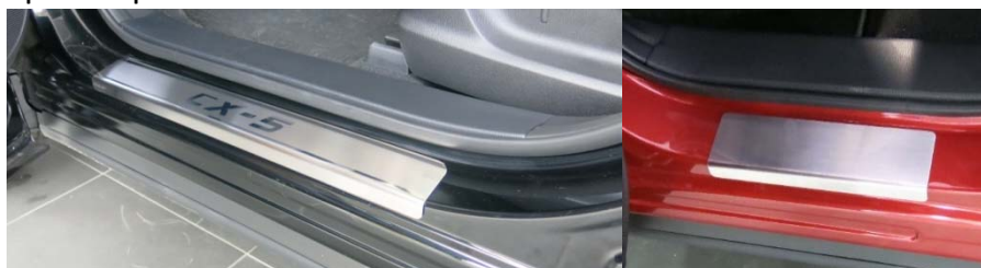
Фото установленных накладок

Накладки на остальные пороги устанавливается аналогичным образом.