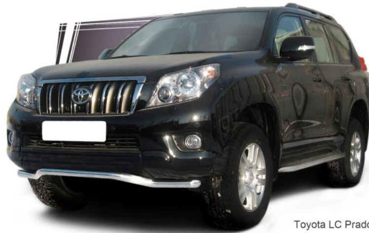
Toyota LC Prado