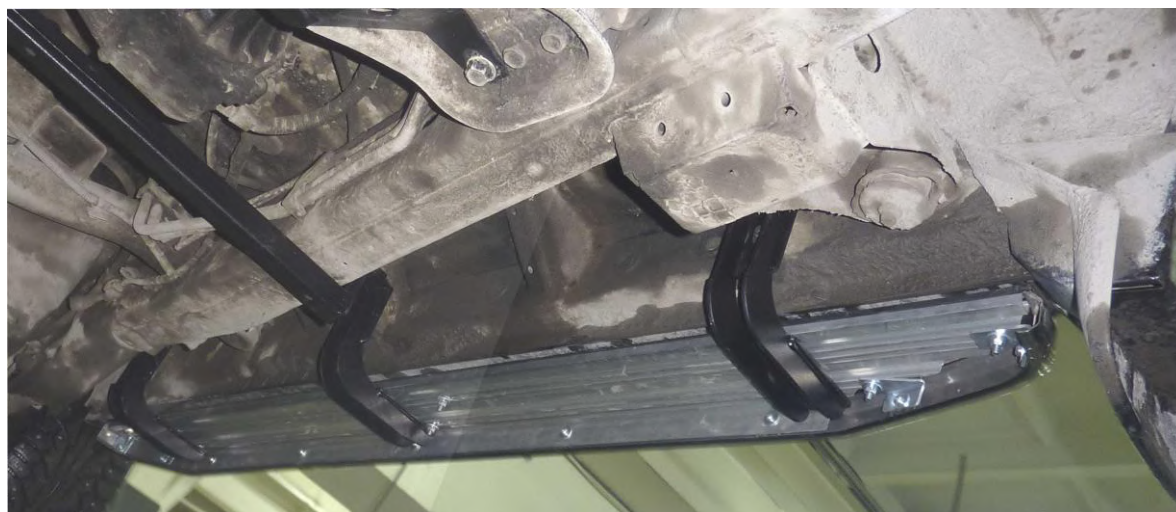
Рис. 4 Вид установленных кронштейнов