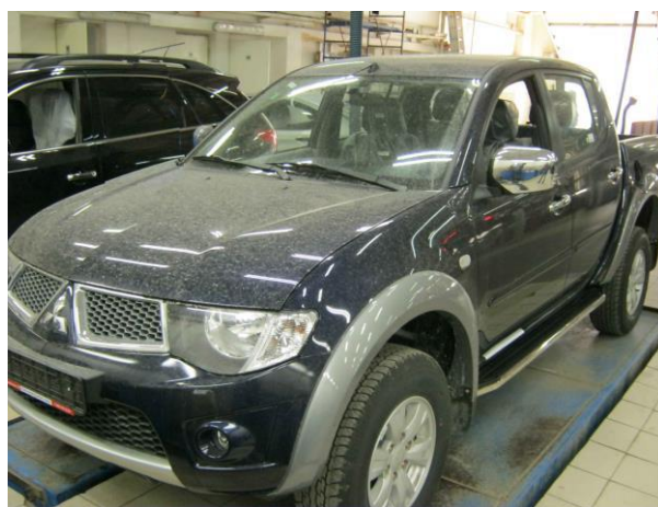
Рис. 7 Вид автомобиля L200 с порогом