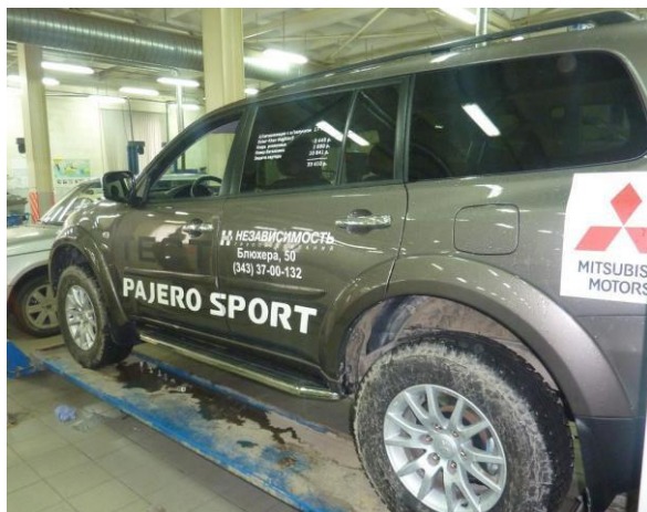
Рис. 6 Вид автомобиля Pajero Sport с порогом