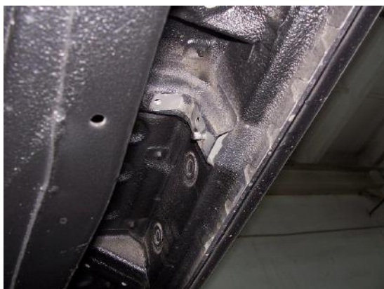
Рис. 2 Место крепления