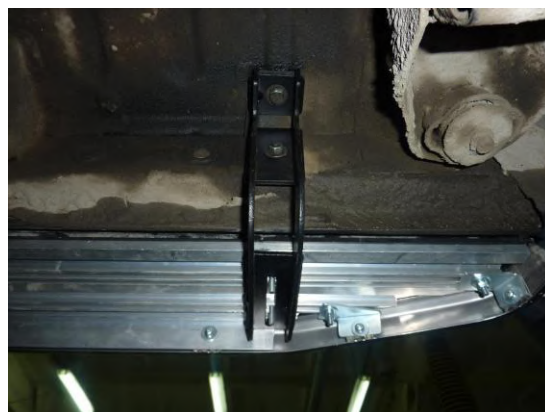
Рис. 3 Установка кронштейна