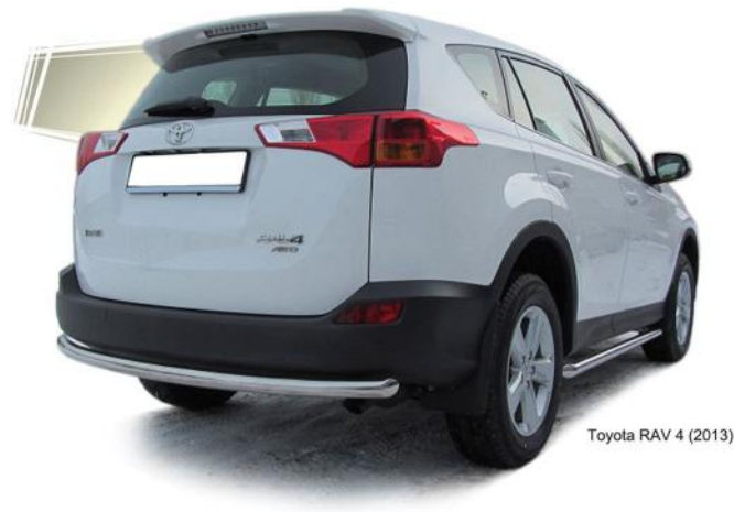
Toyota RAV 4 (2013)