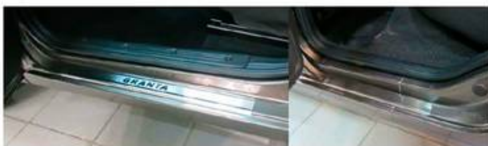
Фото установленных накладок

Накладки на остальные пороги устанавливаются аналогичным образом.