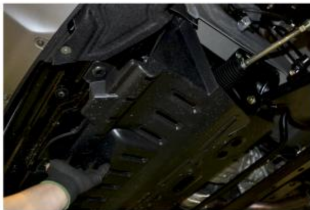
Рис. 1 - Снятие защитного пыльника