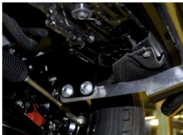
Рис. 4 - Установка защиты переднего бампера