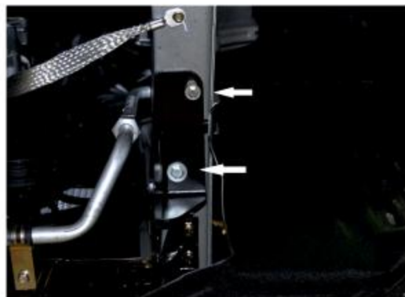
Рис. 3 - Установка кронштейна