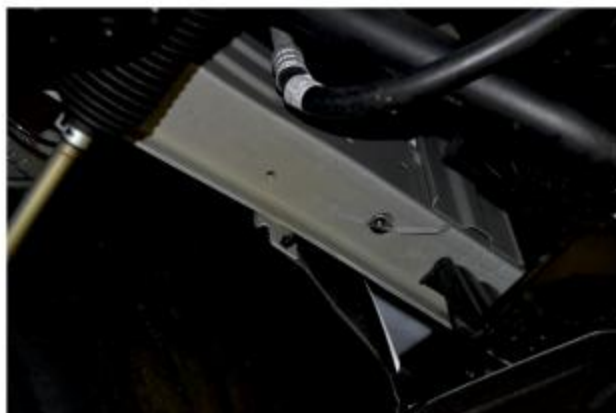
Рис. 2 - Установка закладной гайки