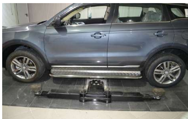
Общий вид автомобиля с порогом

Перед установкой изделия необходимо убедиться, что автомобиль, на который планируется установка, соответствует модельному ряду, указанному в настоящей инструкции. В случае затруднений с определением соответствия обращайтесь службу технической поддержки supp@rivalauto.com . В случае наезда на препятствие необходимо убедиться в отсутствии повреждений и агрегатов автомобиля и пригодности дальнейшей эксплуатации порогов. При правильной установке пороги не должны касаться узлов и агрегатов автомобиля. Производитель вправе вносить изменения в конструкцию порогов.