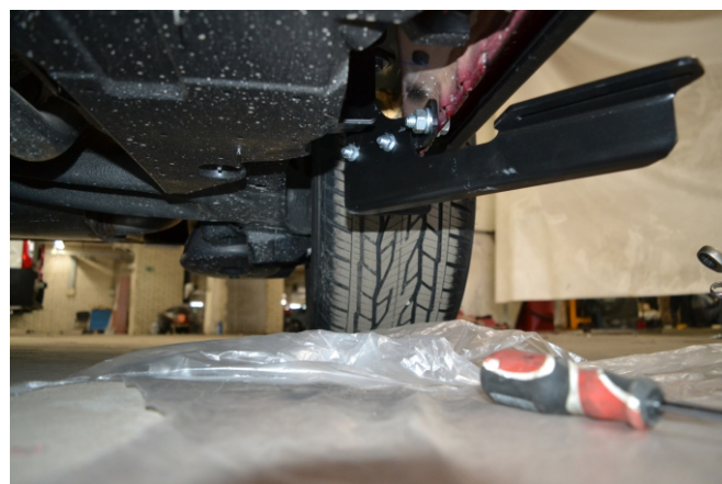
Рис. 4 - Установка заднего кронштейна