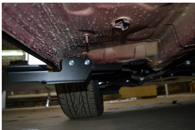
Рис. 3 - Установка переднего кронштейна