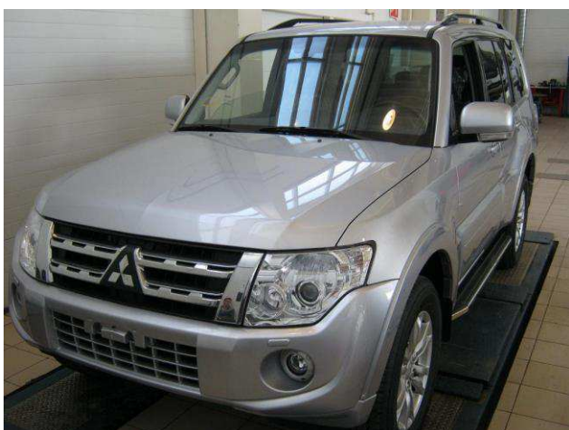
Рис. 6 Вид автомобиля с порогом