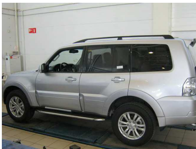
Рис. 7 Вид автомобиля с порогом