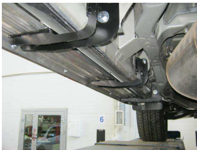
Рис. 5 Общий вид установленных кронштейнов