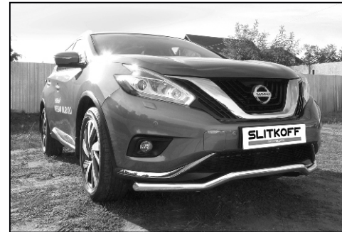
NIM16001 Защита переднего бампера D57 "Волна"