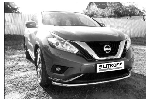
NIM16003 Защита переднего бампера двойная D57 длинная