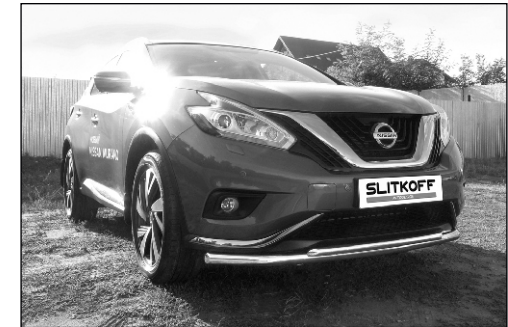
NIM16002 Защита переднего бампера D57 + D42 двойная длинная