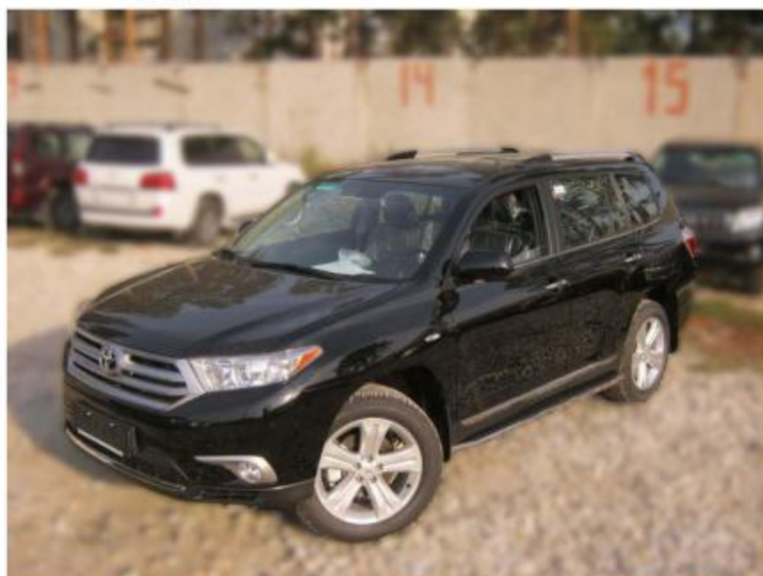
Рис.8 Вид автомобиля с порогом