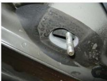
Рис.6 Установка шпильки закладной M10x43