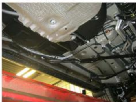
Рис.2 Днище автомобиля со снятыми пыльниками