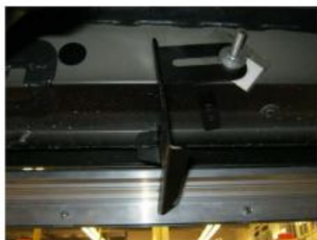
Рис.5 Установка среднего кронштейна