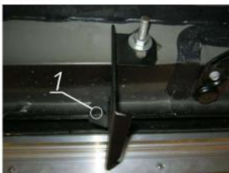
Рис.4 Установка переднего кронштейна