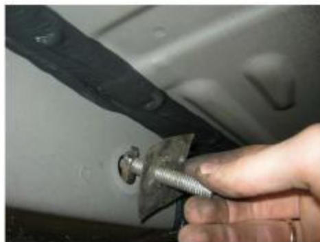
Рис.3 Установка шпильки закладной M10x48