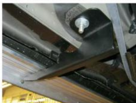
Рис.7 Установка заднего кронштейна