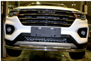
Рис. 3 - Общий вид автомобиля с защитой

Перед установкой изделия необходимо убедиться, что автомобиль, на который планируется установка, соответствует модельному ряду, указанному в настоящей инструкции. В случае затруднений в определении соответствия обратиться службу технической поддержки info@rivalabo.com . В случае наезда на препятствие необходимо убедиться в отсутствии повреждений и визуально автомобиля и пригодности дальнейшей эксплуатации порогов. При правильной установке пороги не должны касаться углов и верха автомобиля. Производитель вправе вносить изменения в конструкцию порогов.