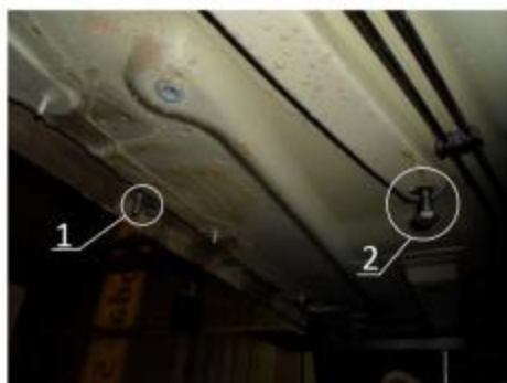
Рис.4 Место установки среднего кронштейна.