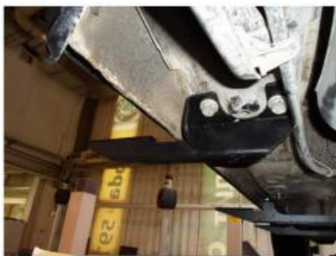
Рис.7 Установка заднего кронштейна.