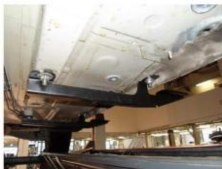
Рис.3 Установка переднего кронштейна.