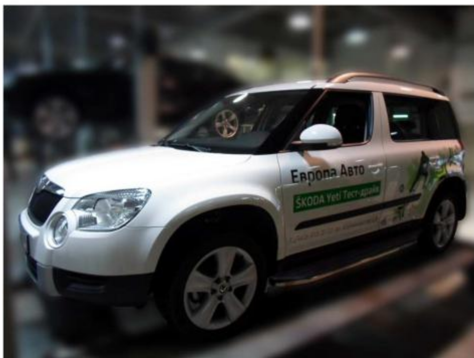
Рис.8 Вид автомобиля с порогом