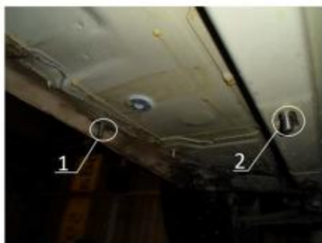
Рис.2 Место установки переднего кронштейна.