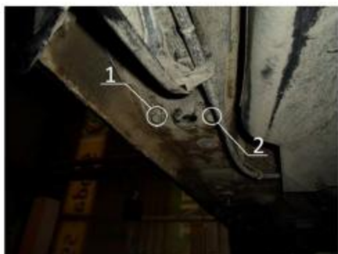
Рис.6 Место установки заднего кронштейна.