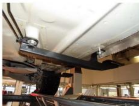
Рис.5 Установка среднего кронштейна