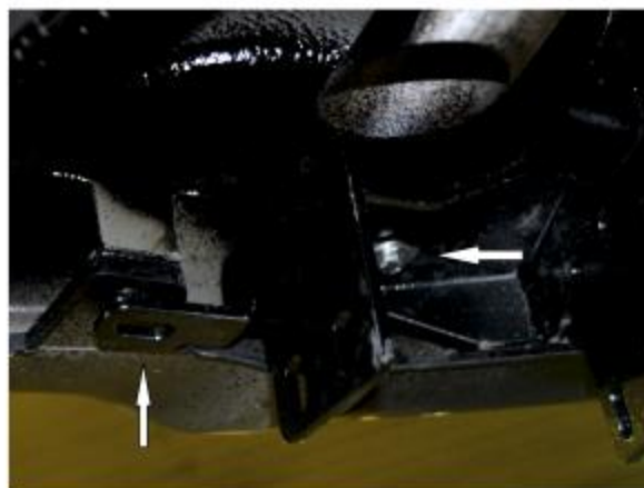
Рис. 2 - Установка кронштейна 1