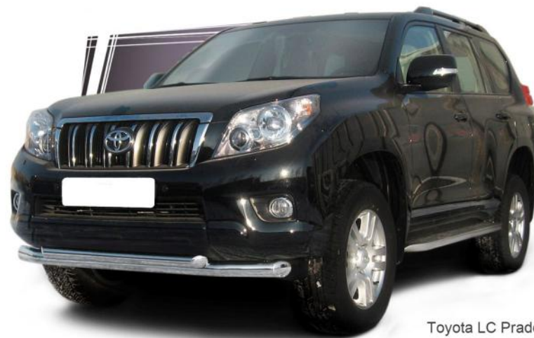
Toyota LC Prado