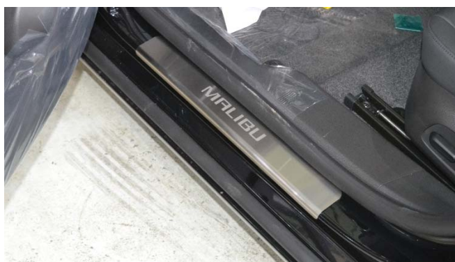
Фото установленной накладки