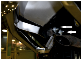
Рис. 3 - Установка уголков

Перед установкой изделия необходимо убедиться, что автомобиль, на который планируется установка, соответствует модельному ряду, указанному в настоящей инструкции. В случае затруднений с определением соответствия обращаться службу технической поддержки info@lifenauto.com . В случае наезда на препятствие необходимо убедиться в отсутствии повреждений и обратиться в автослужбу для дальнейшей эксплуатации защиты. При правильной установке защита не должна касаться углов и верха автомобиля. Производитель вправе вносить изменения в конструкцию защиты.