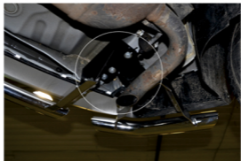
Рис. 5 - Совместная установка уголков R.3305.005 и защиты R.3305.007

Перед установкой изделия необходимо убедиться, что автомобиль, на который планируется установка, соответствует модельному ряду, указанному в настоящей инструкции. В случае затруднений с определением соответствия обратиться в службу технической поддержки expert@lifanauto.com . В случае наезда на препятствие необходимо убедиться в отсутствии повреждений и целостности автомобиля и пригодности дальнейшей эксплуатации защиты. При правильной установке защита не должна касаться колес и агрегатов автомобиля. Производитель вправе вносить изменения в конструкцию защиты.