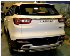
Рис. 4 - Общий вид автомобиля с защитой