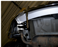
Рис. 1 - Установка левого кронштейна