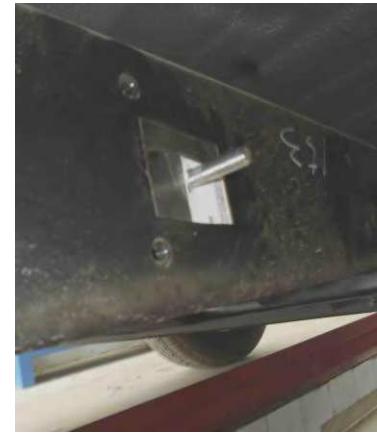
Рис. 7 Установка шпильки закладной М10