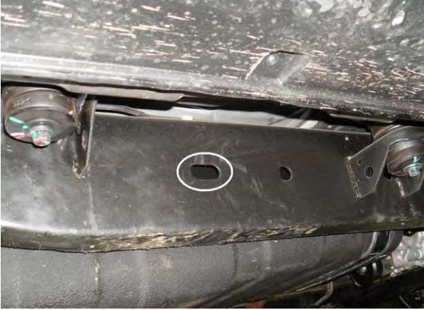
Рис. 6 Место крепления заднего кронштейна