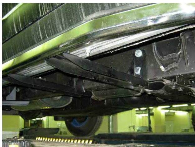
Рис. 3 Установка переднего кронштейна