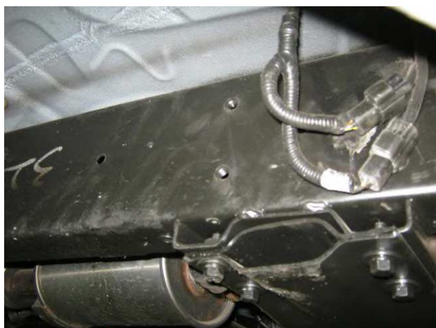
Рис. 2 Место крепления переднего кронштейна справа