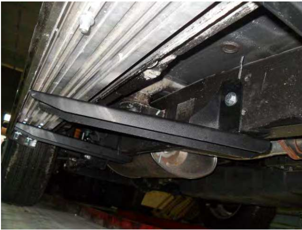
Рис. 8 Крепление среднего кронштейна