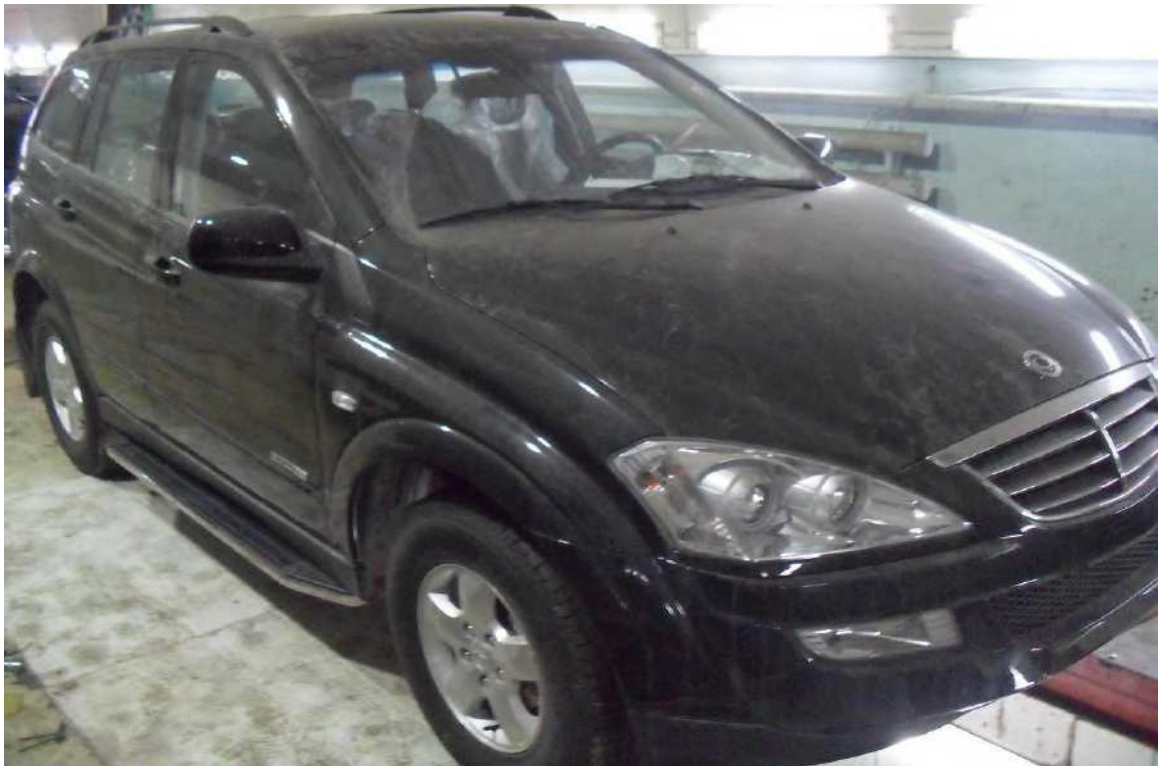
Рис. 10 Вид автомобиля с порогом