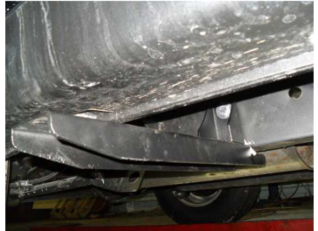
Рис. 9 Крепление заднего кронштейна