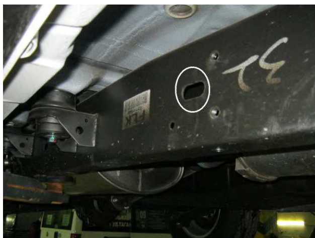
Рис. 5 Место крепления среднего кронштейна