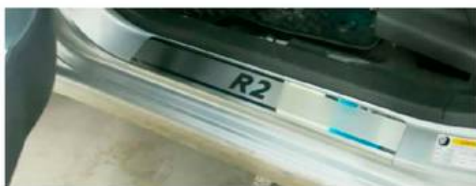
Фото установленной накладки

Накладки на остальные пороги устанавливаются аналогичным образом.