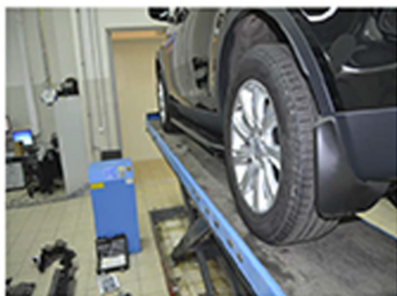
Общий вид автомобиля с порогами

После успешной установки необходимо убедиться, что автомобиль, на котором планируется установка, соответствует специальной схеме, указанной в настоящей инструкции. В случае возникновения и/или выявления каких-либо отклонений, службу технической поддержки необходимо уведомить письменно. В случае сомнений на предмет корректности установки необходимо убедиться в отсутствии повреждений и признаков износа автомобиля и пригодности дальнейшей эксплуатации порога. При правильной установке пороги не должны касаться земли и асфальта автомобиля. Проводить работу только в соответствии с конструкцией порога.